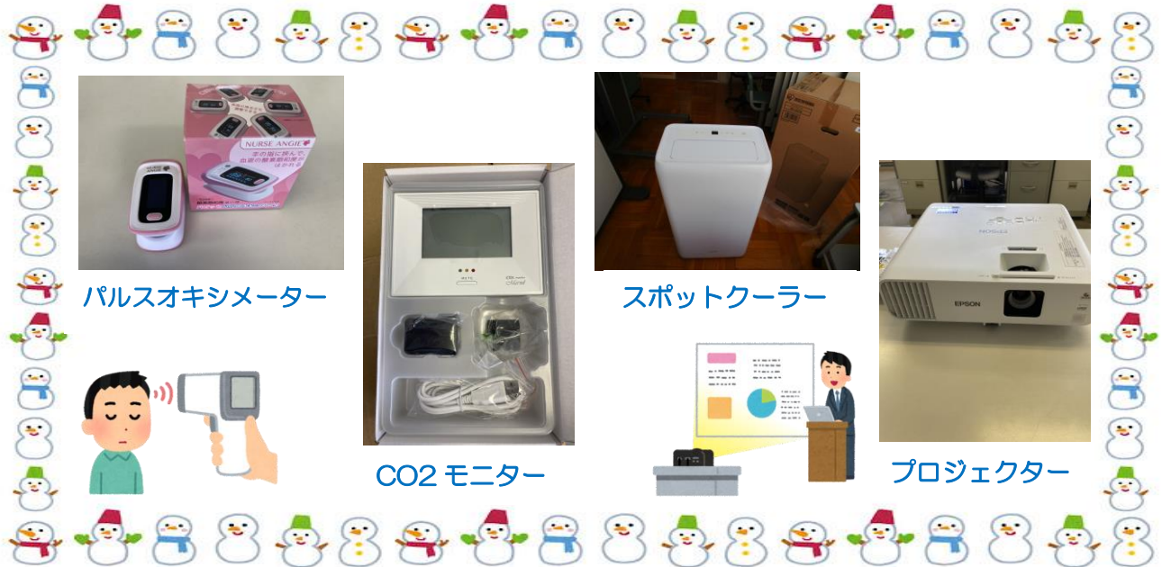
パルスオキシメーター

深川市教育委員会より新型コロナ対策の補助金を活用して納入された備品を一部となりますがご紹介いたします。