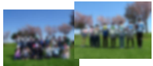
1・2年「まあぶオートキャンプ場」