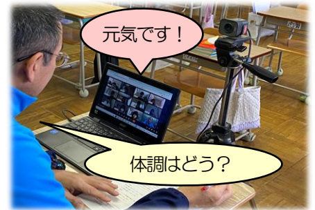
【閉鎖初日の高学年リモート朝の会】

今週の学校はお休みしていた子供たちも元気に復帰し、また明るい声と活気が戻ってきました。明日からは25日間の「冬休み」を迎えますが、コロナによる制限のない今年の冬休みはたくさんの方が動きそうです。充実した冬休みを過ごすとともに、どうぞ健康にご留意ください。