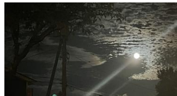
音江の中秋の名月 8年ぶりの満月