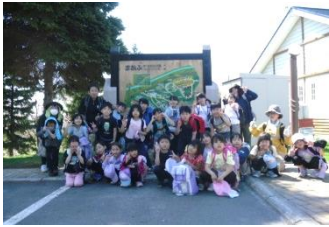
1・2年「まあぶオートキャンプ場」

遠足で培った脚力・体力を、これからは、運動会をはじめとした体づくりの取組に生かしてくれることと期待しています。