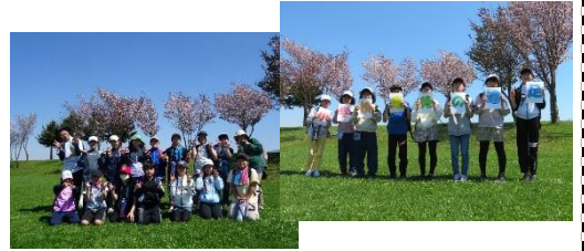
5・6年「グリーンパーク21」