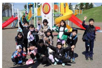
3・4年「妹背牛 遊水公園うらら」