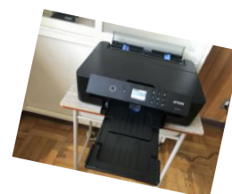
インクジェット プリンター