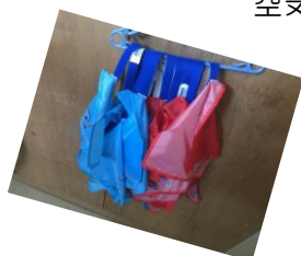
フラッグフット ボール用フラッグ