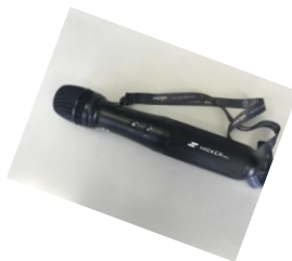
スピーカーアンプ 内蔵マイク