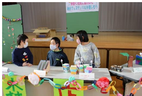
昨年の納小フェスティバルの様子

保護者の皆さんには、後日、案内文書を配布させていただきますので、ぜひ子どもたちの夢とアイデアと実行力溢れる教育活動を御覧ください。