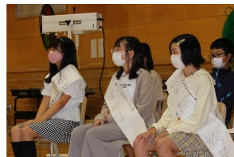
児童会3役に立候補した皆さん

新役員の熱い思いが子どもたち1人1人に伝わり、全校児童がみんなで協力し合うことで、納内小学校がより一層、夢と希望に溢れる楽しい学校となるよう期待しています。