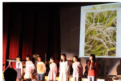
ぼくらの納内、ふるさといつまでも

保護者の皆さんには、子どもたちの発表に最後まで熱い拍手をいただき感謝しております。