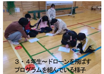
3・4年生～ドローンを飛ばすプログラムを組んでいる様子

株式会社チュブチニカ様に協力をいただき、12月下旬に3～6年生がドローンを利用したプログラミング体験をしたのですが、ドローンがあまり飛びませんでした。このことは、会社でも初めてのことだったそうです。そこで、子どもたちにドローンの楽しさをぜひ味わわせてあげたいとの会社の強い願いから、ドローンが飛ばなかった原因を究明して再度、体験会を開催していただきました。ドローンが飛ばなかった原因は、スマホのWi-Fi機能だったらしく、今回は、それを排除した中での再挑戦となりました。子どもたちは、一度体験しているため、すぐにプログラムを組み、ドローンを飛ばしました。今回はスムーズにドローンが飛び、輪を