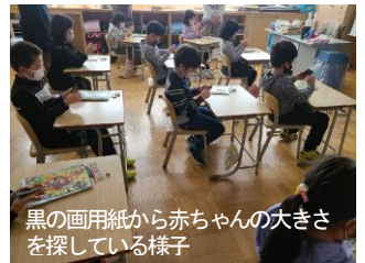
黒の画用紙から赤ちゃんの大きさを探している様子

2年生は、この後、ご家庭で自分自身が赤ちゃんだった頃についてインタビューをすると聞きました。この学習が生かされると良いなと思いました。