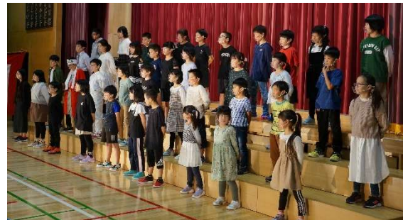
全校合唱「はじまりの気持ち」

保護者の皆様には、子どもたちの真っ直ぐな発表に、最後まで温かい拍手をいただき感謝いたします。