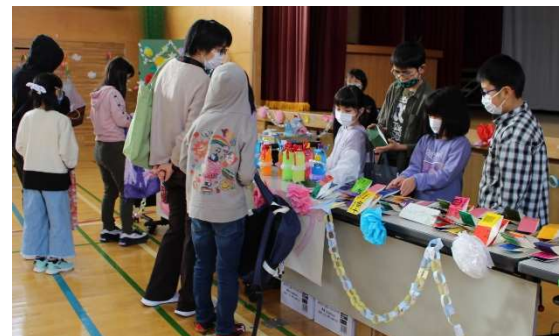
納小フェスティバルの様子(昨年度)

保護者の皆さんには、後日、案内文書を配布させていただきますので、ぜひ子どもたちの体験活動の成果を見に来てください。