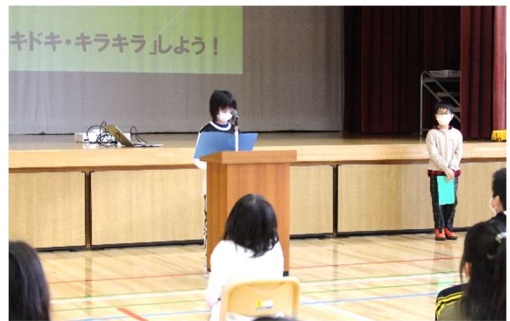
3学期始業式・児童代表の作文発表

1月17日（火）の始業式では、私から子どもたちに、以下のような話をさせていただきました。