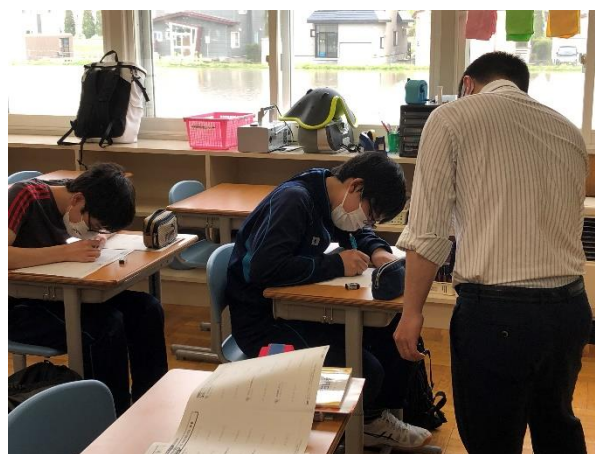
放課後学習会 ～学び直しの機会を～