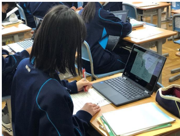
ICT機器の活用 ～わかりやすい授業～