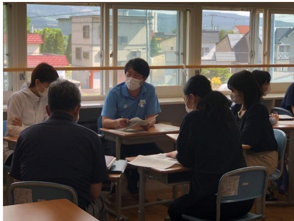
校内研究 ～対話を重視した授業づくり～