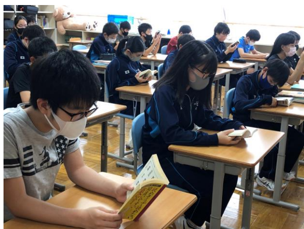
朝読書 ～自由な読書活動～