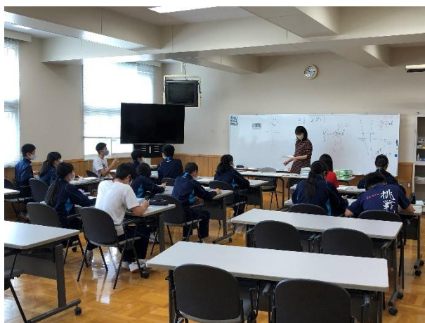
数学少人数授業 ～きめ細かい授業～