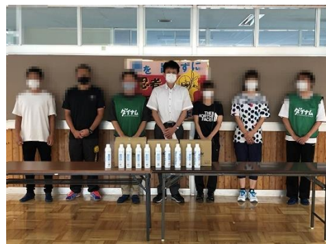
いただいた光触媒スプレー（30本）と作業を行ったメンバー。