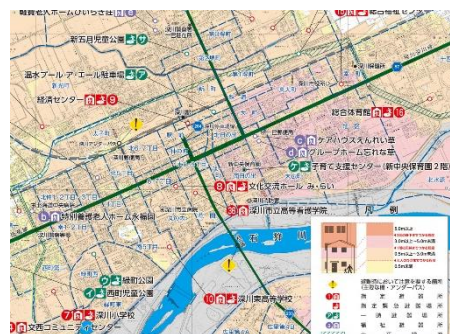
深川市のハザードマップより

火事・地震・不審者対応の訓練に加え、今年度から水害を想定した訓練を加えました。この辺りが水害になる可能性はほぼないかと思いますが、深川市のハザードマップによると、大雨や堤防が決壊した際には、 一已小学校あたりは50cm～3mの高さまで水が押し寄せるとの予想です。