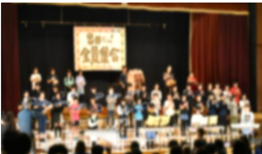
5年生 表現 「＼出番だよ！/全員集合」