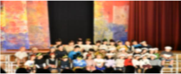
1年生 音楽・劇 「はじめのことば& じごくのあばれんぼう」

『見る人が、楽しく、印象に残る学習発表会にしよう！！』のテーマのもと、一人ひとりが目標をたて、昨日の自分より一歩成長しようとする姿がとても頼もしく感じました。ご家庭での衣装等の準備等もありがとうございました。今回の学びから得たことを、更に今後の活動に生かしてほしいと願っています。