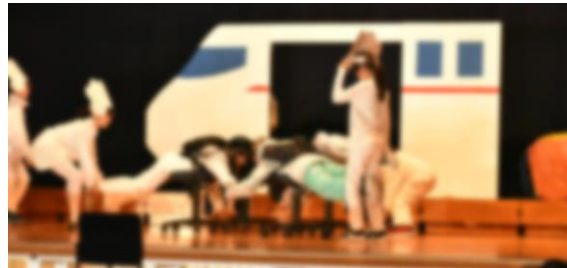
4年生 劇 「已小 仮装大賞」