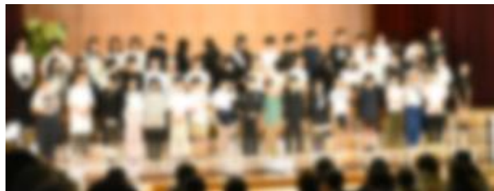
6年生 器楽 劇 合唱 あいさつ 「怪獣の花唄・お母さんの木・つばさをください・おわりのことば」