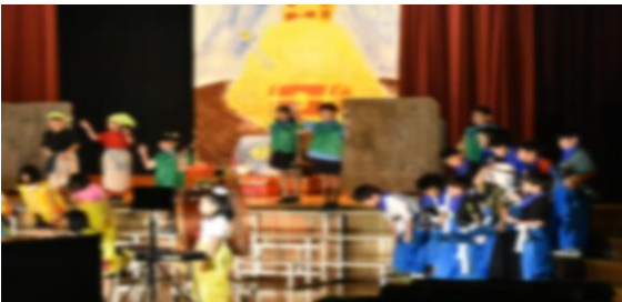
3年生 総合劇「アリババ」