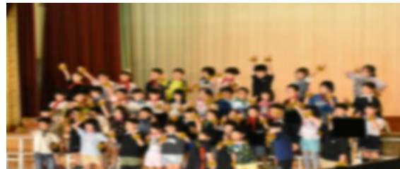
2年生 音楽・ダンス 「トキメキダイアリー」ほか