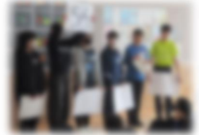
2/21 6年「4校交流」 今年の担当は北新小！

この時期は、1年生から6年生まで、体格もさることながら各活動の様子や言動などから、心身共に成長したことを感じるが多くなります。きっと本日の「送る会」もそれを感じることができると確信しているところです。