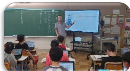
研究授業しています

学年も半分まで到達しました。4月当初の意欲的な姿から、今までの積み重ねが必要となりちょっとずつ学習を難しく思ったり、考えるのを諦めてしまったりして、姿勢が悪くなってきているお子さんもいるようです。勉強がわからないと学校も楽しくなくなってきます。昔ながらのアナログな勉強方法（ノートに書く・声に出して読む→繰り返し練習する）も大変有効なことは間違いありません。手を動かすことや声に出すことは脳への刺激が高まるからです。 習ったことを使ったり、説明したりできるようになるとさらに力がつく と言われていました。