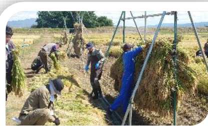
「5年生の稲刈り～今年も鎌等の指導やはさがけ作業に感謝です」

さて、最近は気持ち良く晴れる日も多いように感じますが、 雨の日 は本当に肌寒くなってきました。先日の雨の日に下駄箱に入っている 長靴 を数えてみたところ全校で 37足 （全校297名）でした。その日は、ちょっと雨脚も強く、靴だけではなく靴下をぬらした子もかなりいたようです。学校で履き替えるのも予備に限りがありますし、干して乾かすことも難しい状況です。これからは一雨毎に寒さも増していきます。家からの近さもあるかと思いますが、足が冷たくならないようよろしくお願いいたします。