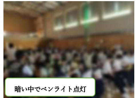
暗い中でペンライト点灯

令和6年度前期の後半もあと2週間となり、いよいよ今年度半分の教育活動が終わろうとしています。深川中学校学校祭も大盛況の中、おかげさまで、心に残る素敵な一日にすることができました。日頃の授業や委員会活動、係活動などと違い、非認知能力（意欲・協調性・粘り強さ・計画性・自制心・創造性・コミュニケーション能力など、特定できない個人の特性による能力のことを言います）を駆使して本当によくがんばりました。テーマを考えながらリサイクル工作を製作したり、ダンスのフォーメーションを考えたり、協力して創作画のちぎり絵に取り組んだり、クラスみんなでハーモニーを奏でる合唱に取り組んだり、創造力・想像力を刺激する有意義な学校行事でした。さらに今年度は、開祭式でペンライトを使って盛り上げたり、吹奏楽発表で部員が準備している合間を使って、生徒会長が令和7年度から導入する新制服を着用して全校の生徒の周りを、トップモデルのように“ランウェイ”する場面がありました。生徒会執行部のアイディアと努力に脱帽でした。その生徒会執行部も後期からは、1・2年生中心の組織へと様変わりします。前期の反省を活かして、より良い学校生活につながるように、学習面、そして生活面をさらに充実させてほしいと思います。