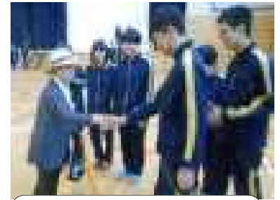
福祉学習で来校された方とふれ合いました

私は、その言葉を聞いて本当に嬉しくなりました。生徒たちが福祉学習で様々な体験を重ねる中で、来校された多くの方々との心の触れ合いが深まったようです。