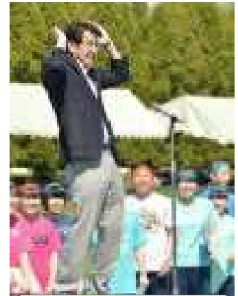
みんなが元気に声を出してくれてとても嬉しく思いました。

生徒の皆さんも、これから中体連そして学校祭と大きな行事があります。これからも若者らしく、大きな声を出して生き生きと自分を表現していくとともに、仲間と互いに支え合い高め合いながら、どの学年もグングンと伸びてほしいと願っています。