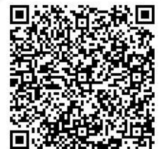
【深川小ホームページ】

南極大陸に住むペンギンは、辺り一面、氷の世界なので、食べるために、海に潜って餌をとらなければなりません。でも、海に潜ると、ペンギンの敵である「シャチ」や「アザラシ」が待ち構えていて、食べられてしまうかもしれません。ですから、みんな一番先に海に飛び込みたくありません。でも、早く飛び込まないと餌が無くなってしまいますので、みんな、できるだけ岸壁の方に集まっています。しばらくするとその中の1匹が海に飛び込み、周りにいる沢山のペンギンは、その飛び込んだペンギンがアザラシやシャチに食べられてしまわないかどうか見て、安全を確かめてから、次々と海に飛び込むそうです。