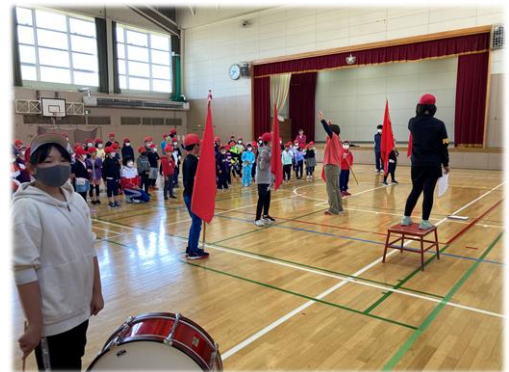
運動会全校練習（赤組の様子）

今後も、家庭、地域、学校が連携し、子ども達の健やかな成長を支えていきたいと思っておりますので、ご支援・ご協力を宜しくお願いいたします。